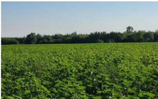
Foto 15. Teren nieruchomości