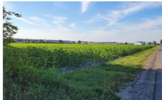
Foto 16. Widok na działkę z ulicy Wiatrakowej