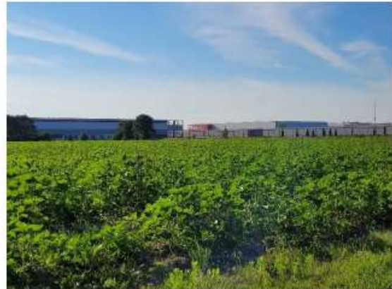
Foto 4. Sąsiedztwo działki 77 od wschodu