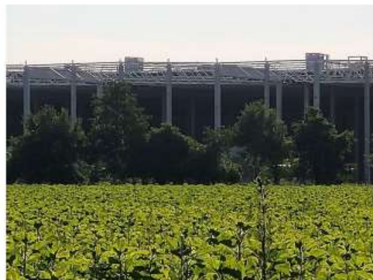
Foto 2. Sąsiedztwo nieruchomości od wschodu