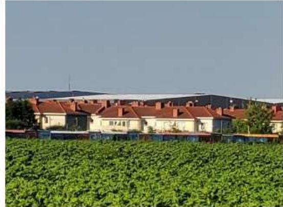
Foto 8. Park Agat w dalszym sąsiedztwie