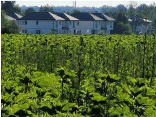
Foto 3. Sąsiedztwo nieruchomości od wschodu

Najbliższe otoczenie nieruchomości stanowią tereny rolne, zabudowa produkcyjno – magazynowa i usługowa. W dalszym otoczeniu również zabudowa produkcyjna, mieszkaniowa oraz liczne zabudowania handlowo – usługowe.